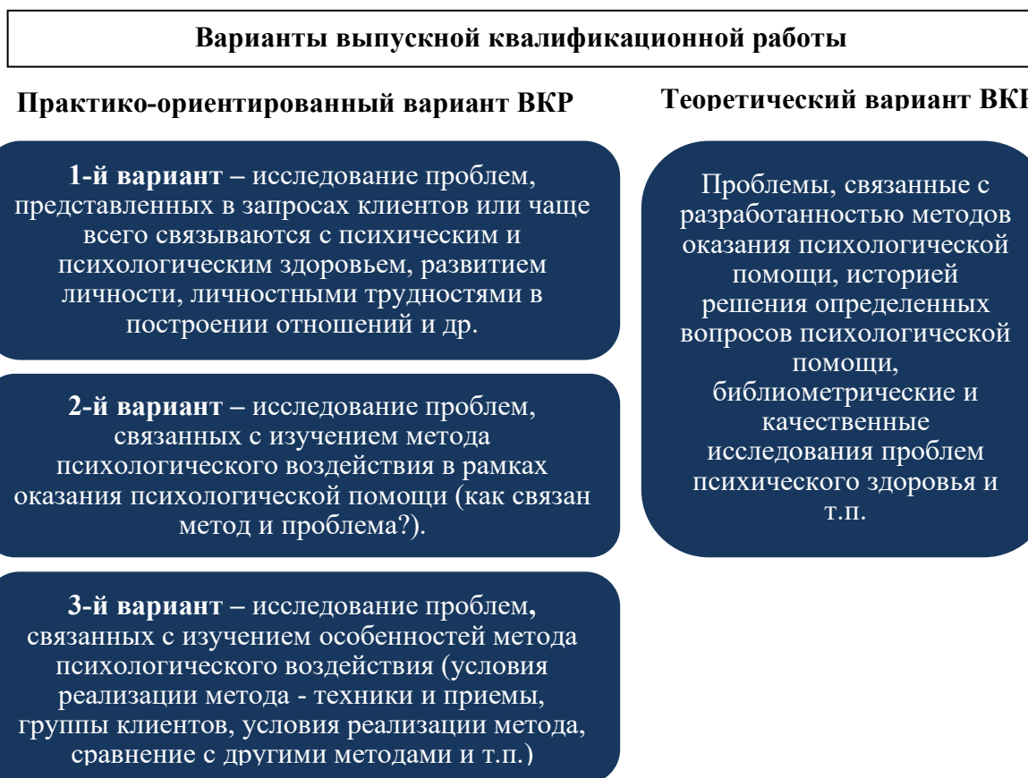
Рис.1. Варианты выпускной квалификационной работы

Для всех вариантов ВКР среди базовых направлений психологической помощи в направлениях подготовки 37.03.01 Психология (профиль: «Консультативная психология», «Практическая психология»), 37.04.01 Психология (программы: «Консультативная психология», «Психология личности») и 37.05.01 Клиническая психология (специальность «Психолого-педагогическая и консультативная помощь субъектам образовательного процесса») определены: психоаналитическое, поведенческое и экзистенциальное направления.